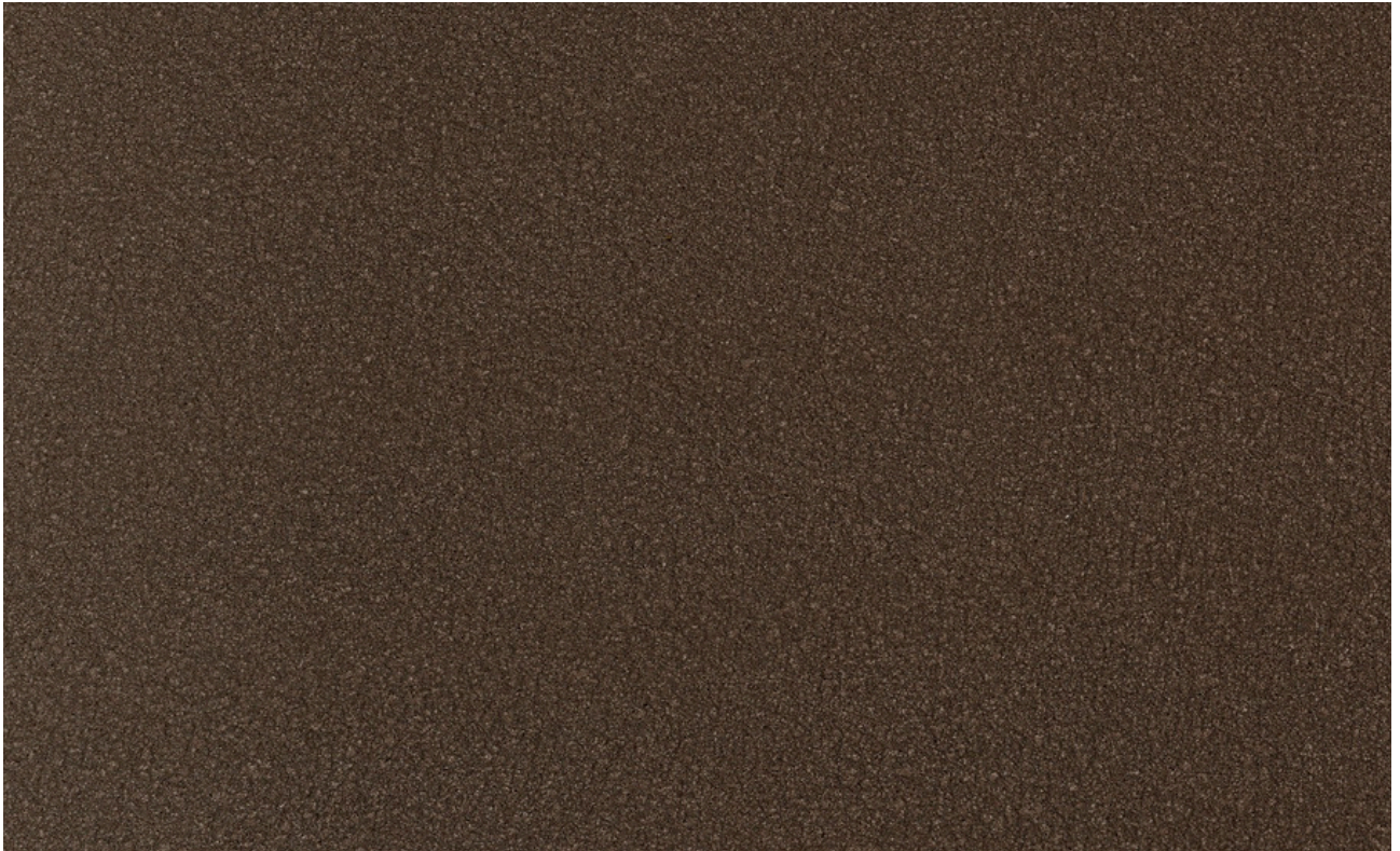
skai® VyP Coffee dark roast F7901036

Un tejido de tapicería transpirable basado en plantas. Para la producción de este material especial se utilizan componentes reciclados y naturales. Sin embargo, lo revolucionario del proceso es que Continental ha conseguido incorporar posos de café a la producción.